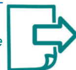
Grille proposée le 30 novembre dernier par la FCD